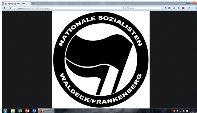
Abbildung 2: Die Aneignung des Antifa-Logos